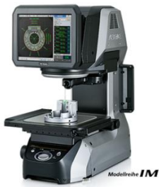
Optisches automatisches Messgerät Keyence IM7020