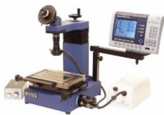
Optisches Messgerät Marcel Aubert MA 173-183 mit Quadra Check200